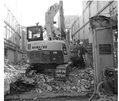
解体工事には必須の資格です